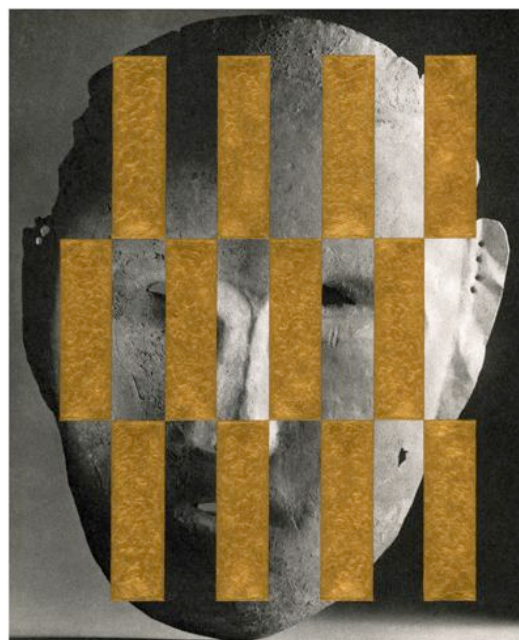
David Balliano, UNTITLED_Mirror, 2012 acrylique sur papier 24,9 x 20,4 cm. (framed) 56 x 48,6 x 3 cm